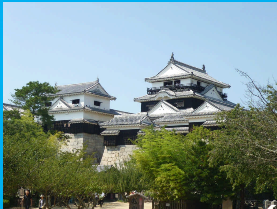
松山城天守閣 築城年:1602年(着手)