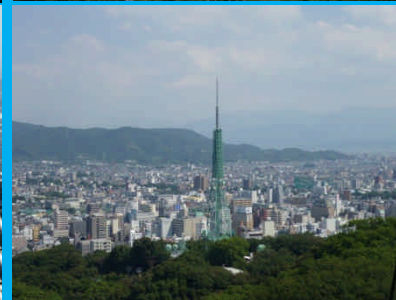
松山城天守閣からの眺望