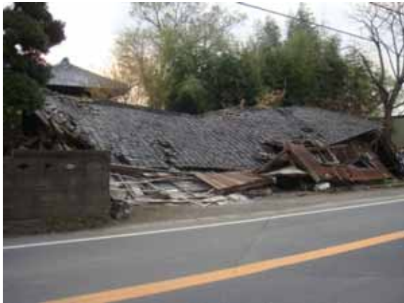
倒壊家屋と奥の母屋