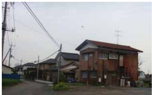
周辺状況（被害軽微）