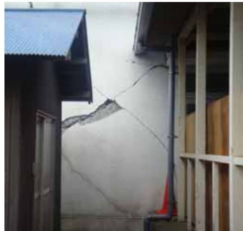
筑西広域 ，茨城県筑西市折本，4月26日 15:45