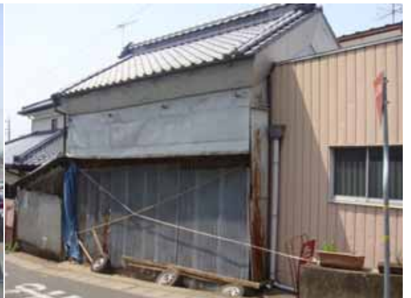
筑西市街 ，茨城県筑西市乙，4月27日 10:45