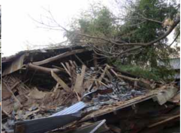
屋根は洋小屋（キングポストトラス）