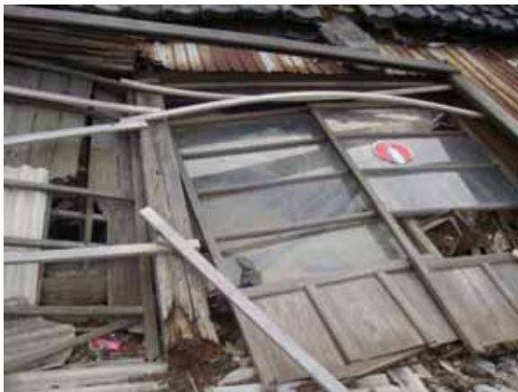
道路の反対方向へ倒壊．柱脚の腐朽