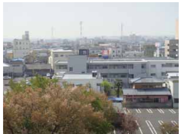
4月27日 9:30 筑西市街地の様子（駅南側のホテル7階より）