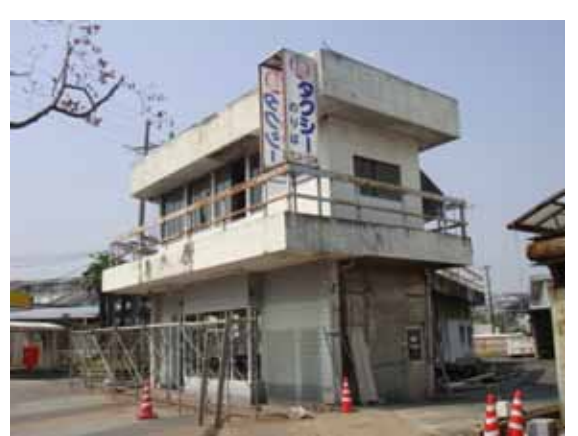
筑西市街 ，茨城県筑西市乙，4月27日 9:45