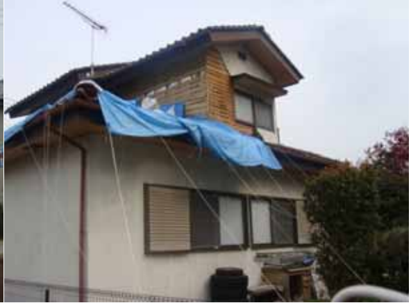
筑西広域 ，茨城県筑西市折本，4月26日 15:14