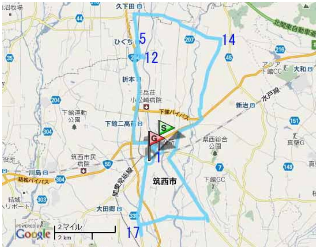
図 筑西市広域調査対象の野地図（青線が経路，番号は下表に対応）