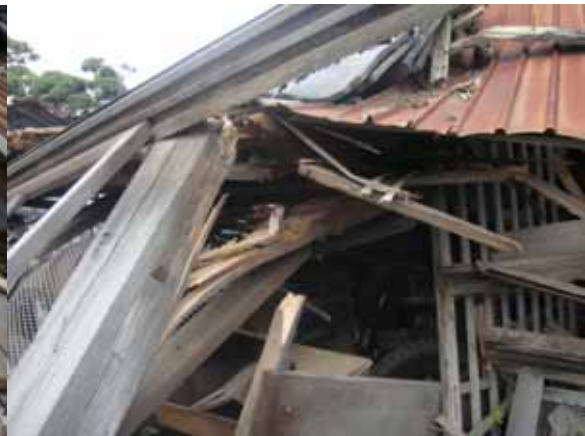
柱が内法位置で曲げ破壊