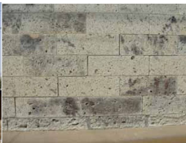
筑西市街 27，茨城県筑西市丙，4月27日 13:30 蔵，石造2階建て，小破・屋根瓦ずれ，目地のずれ，石材の割れ