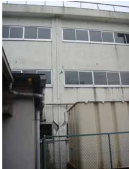
北校舎北面・柱のせん断破壊