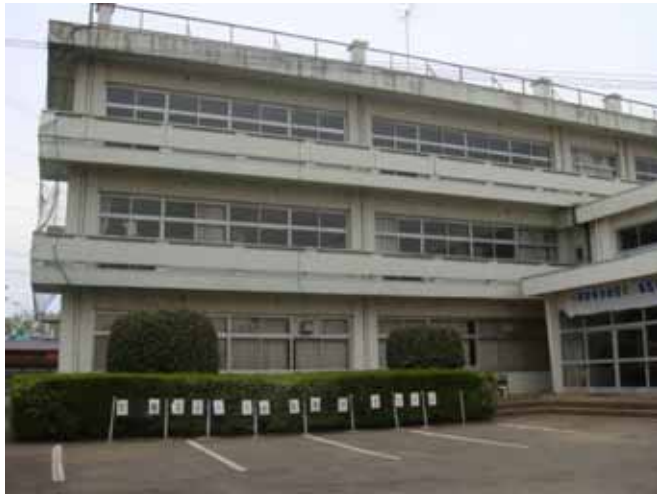
北校舎南面（右に少し見えるのが南校舎）