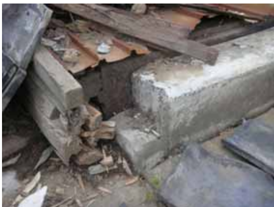
基礎（CB アンカーなし）から脱落した土台，ホゾの破損